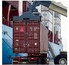
Áncash, Piura y La Libertad con buen nivel de exportaciones