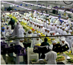
Plan de agroexportación se ejecutará para llegar a US$ 7,000 millones el 2018