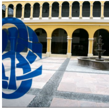
BCR: impacto inflacionario por alza de ISC será de hasta 0.3 puntos por única vez