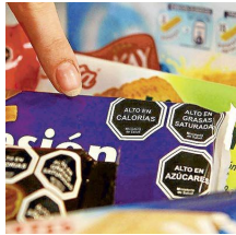
Ley de etiquetado (D.Leg. No.1304)