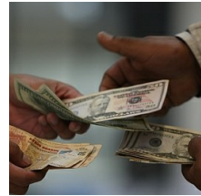
Tipo de cambio cierra a la alza por incertidumbre política local, pese a avance del dólar