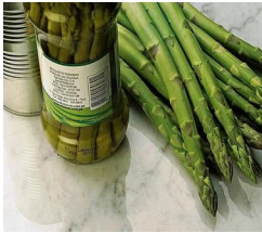
Exportaciones Peruanas de espárragos