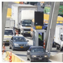
Vienen 12 nuevos peajes a nivel nacional que pueden generar conflictos sociales, advierte Ositrán